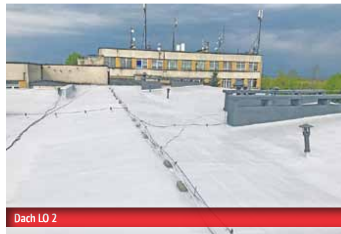
Dach LO 2