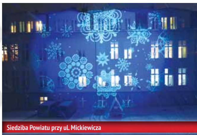
Siedziba Powiatu przy ul. Mickiewicza