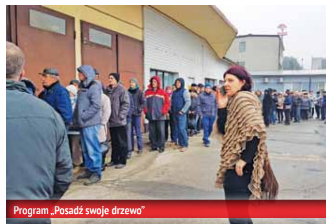
Program „Posadź swoje drzewo”