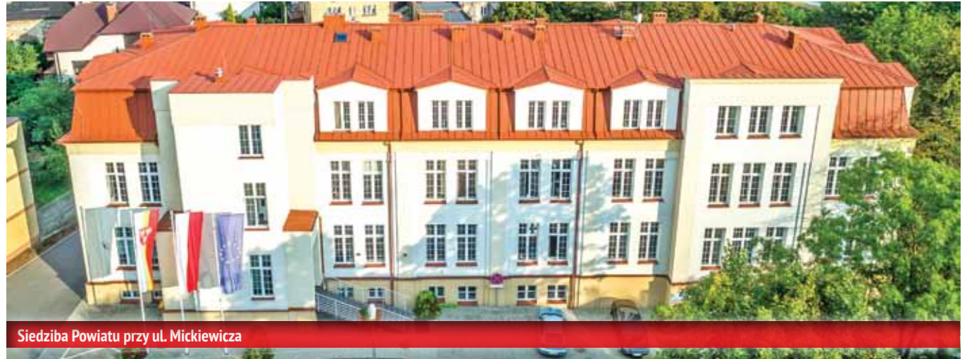
Siedziba Powiatu przy ul. Mickiewicza

Oddaliśmy do użytku w nowym miejscu /aleja Tysiąclecia/ budynek w którym mieści się wydział komunikacji. Uroczymy delegaturę tego wydziału komunikacji w Wolbromiu.