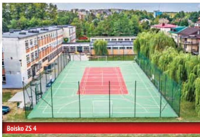
Boisko ZS 4