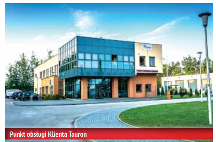
Punkt obsługi Klienta Tauron