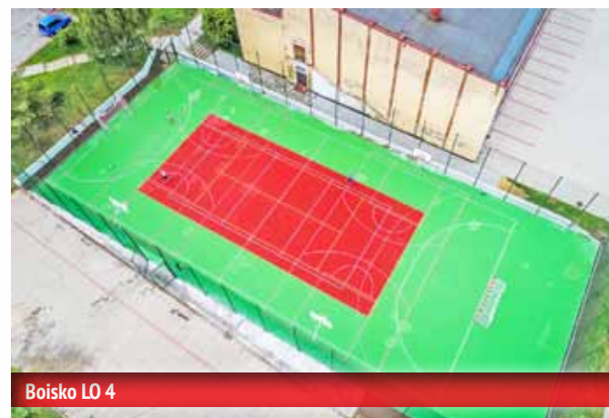
Boisko LO 4