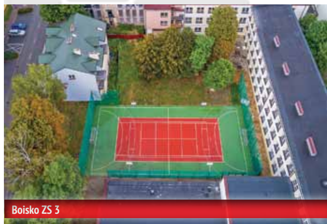
Boisko ZS 3