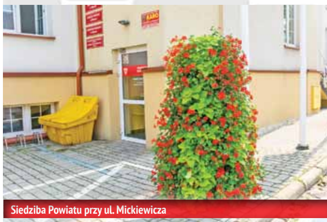
Siedziba Powiatu przy ul. Mickiewicza