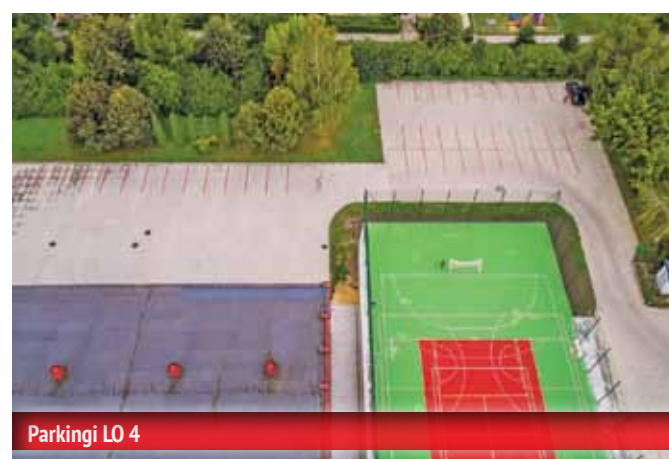
Parkingi LO 4