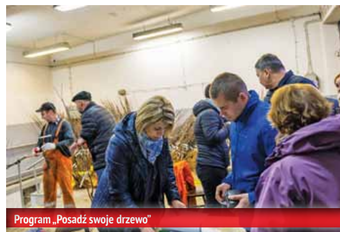
Program „Posadź swoje drzewo”