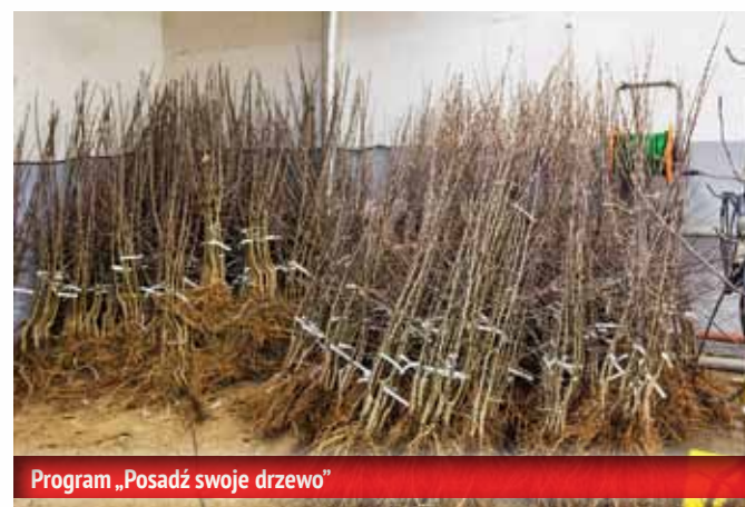
Program „Posadź swoje drzewo”