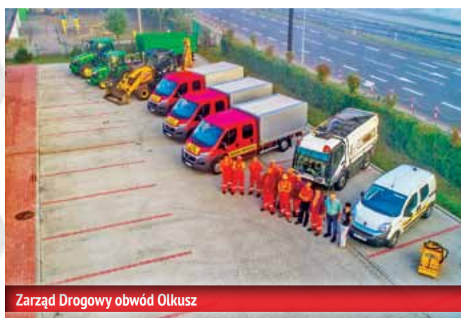
Zarząd Drogowy obwód Olkusz