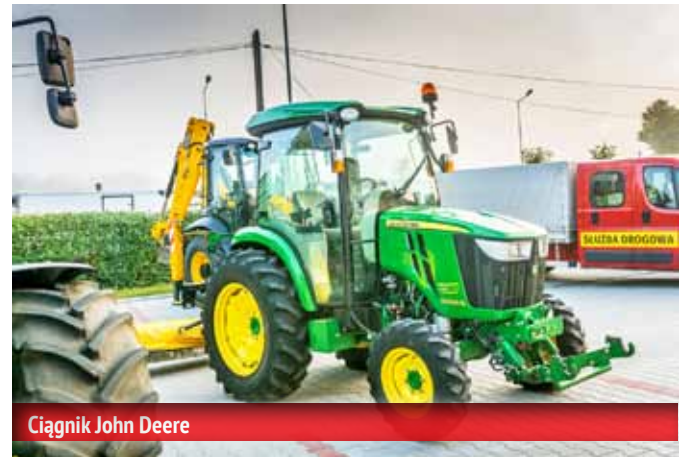
Ciągnik John Deere