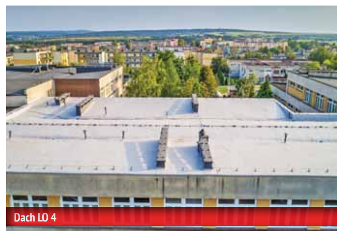
Dach LO 4