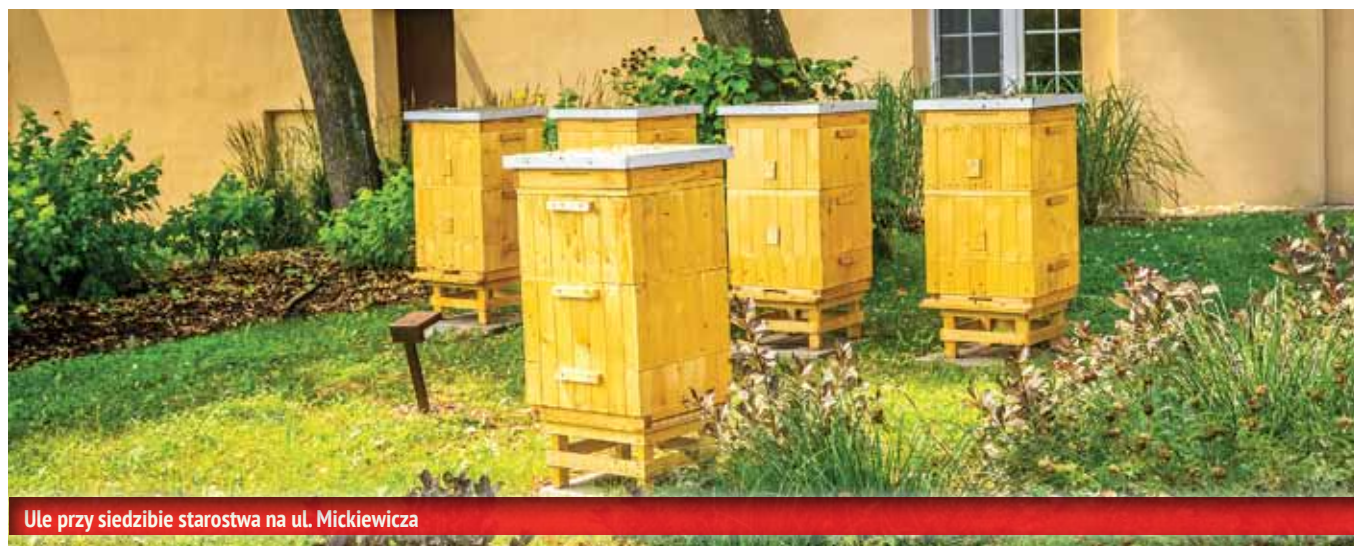
Ule przy siedzibie starostwa na ul. Mickiewicza