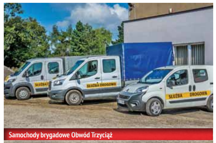
Samochody brygadowe Obwód Trzyciąż