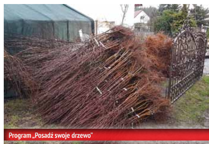
Program „Posadź swoje drzewo”