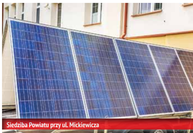
Siedziba Powiatu przy ul. Mickiewicza