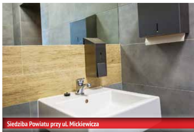
Siedziba Powiatu przy ul. Mickiewicza