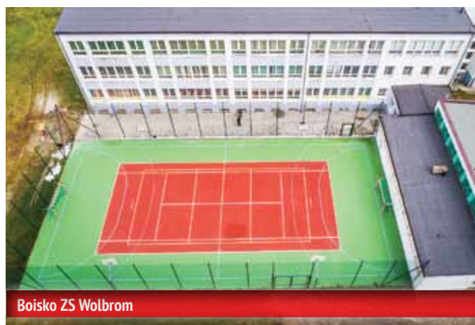
Boisko ZS Wolbrom

Małopolska Chmura Edukacyjna – ponad milion złotych