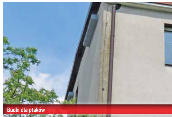
Budki dla ptaków

Najlepszym sprzymierzeńcem człowieka w walce z uciążliwymi komarami są jerzyki. Te pożyteczne ptaki potrzebują wsparcia, ponieważ ich naturalne siedliska są niszczone. W trosce o zachowanie populacji, ale także i walkę z komarami zainstalowaliśmy budki lęgowe dla tych pożytecznych ptaków.