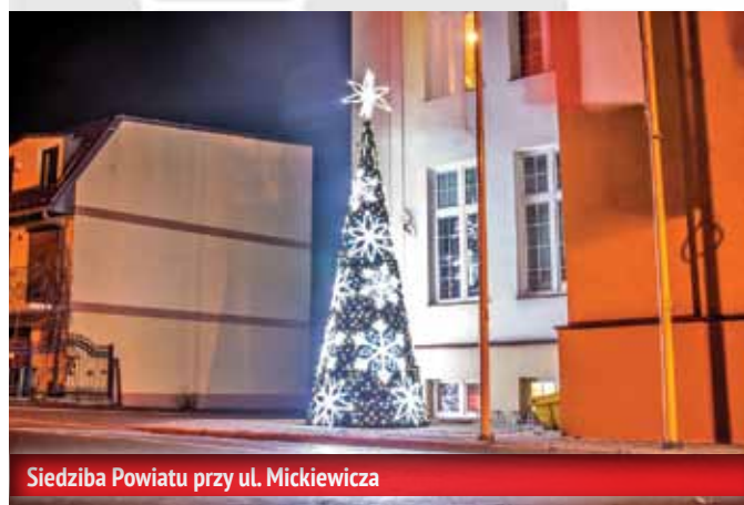
Siedziba Powiatu przy ul. Mickiewicza