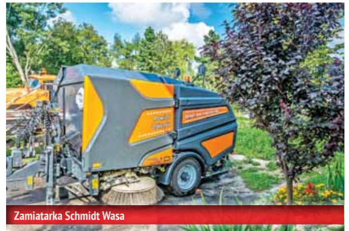
Zmiatarka Schmidt Wasa