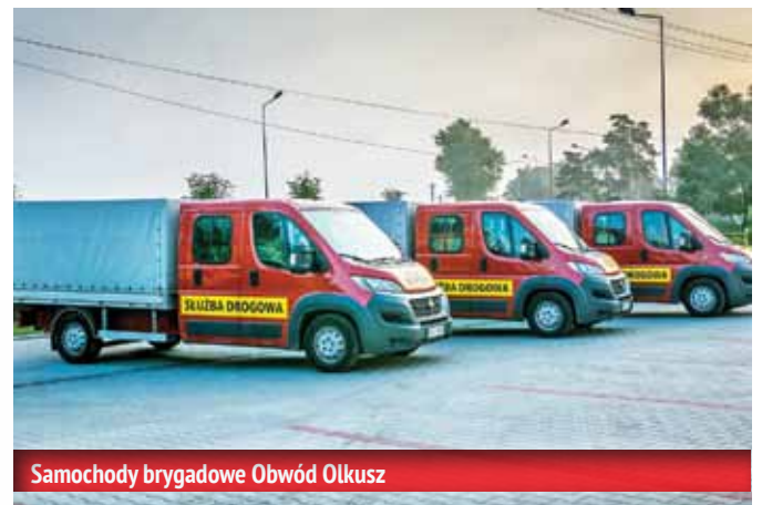
Samochody brygadowe Obwód Olkusz