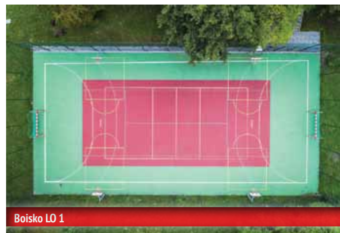
Boisko LO 1